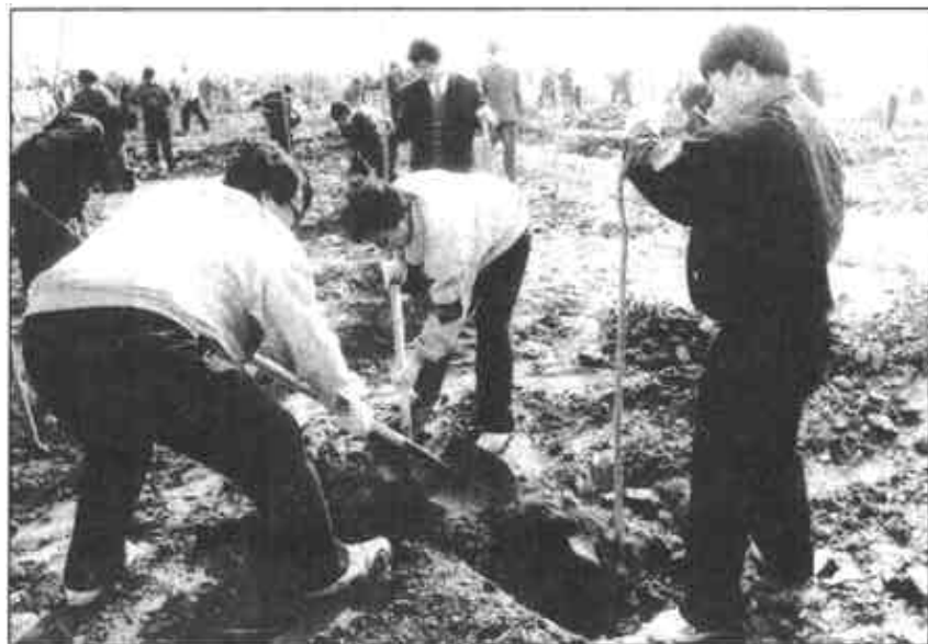
3月12日, 市机关义务植树活动分别在东营区六户镇武家大沟南岸和垦利县城以南南溢河两岸工地上展开, 市领导和市直及东营区、垦利县的190余个单位, 6000余名干部职工参加了此次义务植树活动。

在提出改进意见, 积极进行整改。座谈会上, 陈锡山认真听取了各县区及市直有关部门负责同志关于“三讲”教育中学习方式、组织方式、思想交流、具体整改措施等问题的意见和建议, 并就有关方面与大家进行了详细讨论。大家一致认为, 省委确定在我市进行市级领导班子和领导干部“三讲”教育试点, 是对东营的信任和鞭策。市级领导班子和领导干部中开展的以“讲学习、讲政治、讲正气”为主要内容的党性党风教育, 在省委正确领导下, 在省委赴东营巡视组的具体指导下, 在全市广大党员、干部、群众的关心支持下, 市五大班子以高度负责的精神, 饱满的政治热情和求真务实的态度, 积极参加“三讲”教育, 初步解决了党性党风方面存在的一些突出问题。现在“三讲”教育已进入“认真整改, 巩固提高”的最后阶段, 要进一步深化和完善市级各班子和成员的整改措施, 增强针对性和可操作性, 主动接受群众监督, 对落实不力、群众意见大的限期重新整改, 直到群众满意为止, 要把整改措施与做好今年的各项工作紧密结合起来, 确保完成今年的各项任务目标, 以优异成绩迎接建国50周年。(刘西光)